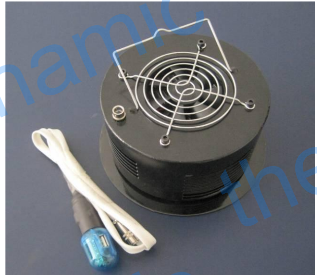
5W 直燃式发电机实物图 (USB 插座和接线, 输出 5V 直流电)