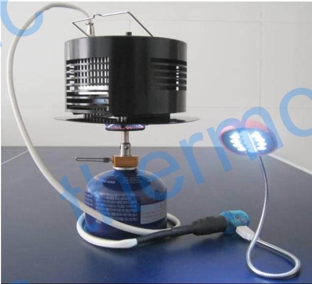
把发电机直接放在火炉上即可提供电力。